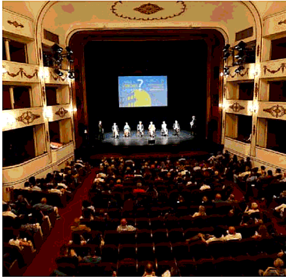
Il Teatro Nuovo Qui la cerimonia di premiazione della VI edizione del premio