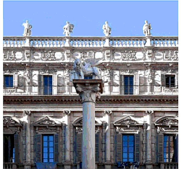
Casa Maffei Il Museo sarà aperto al pubblico del premio