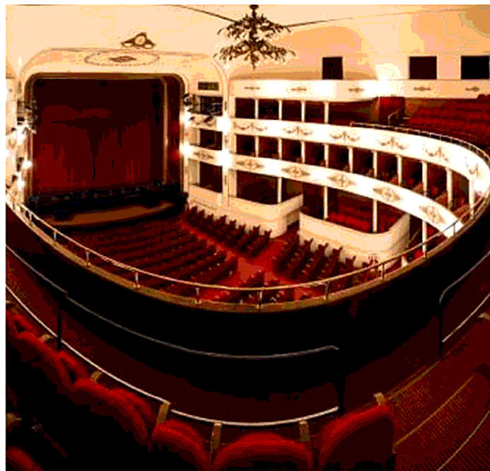
L'evento Neri Pozza Appuntamento al Teatro Nuovo di Verona per la cerimonia di premiazione

iniziative promosse da Gian Luca Rana sono «OnDance», la grande festa della danza voluta da Roberto Bolle per avvicinare il grande pubblico a questa straordinaria disciplina, il progetto «67 Colonne per L'Arena», promosso dalla Fondazione a sostegno del festival lirico. Ultimo solo in termini cronologici il progetto didattico avviato con Palazzo Maffei Casa Museo per far scoprire e rendere fruibile l'arte ai giovani studenti in un eccezionale luogo di cultura nel cuore del territorio veronese. «Imprenditoria e arti sono unite in modo indissolubile grazie alla condivisione di valori fondamentali come il ruolo della creatività, la forza della bellezza, la passione del creare, la spinta innovativa verso il futuro. Questa convivenza - prosegue Gian Luca Rana - è alla base del nostro impegno a fianco del premio Neri Pozza, una casa editrice il cui stile distintivo rappresenta un'eccellenza nel panorama culturale internazionale».