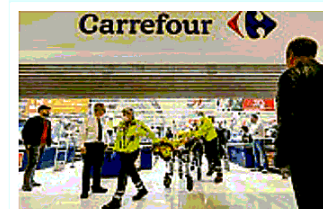
27 ottobre Sei persone accolte al Carrefour di Assago