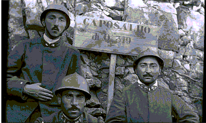
In divisa Un giovane Carlo Emilio Gadda, primo da sinistra, al fronte durante la Grande Guerra