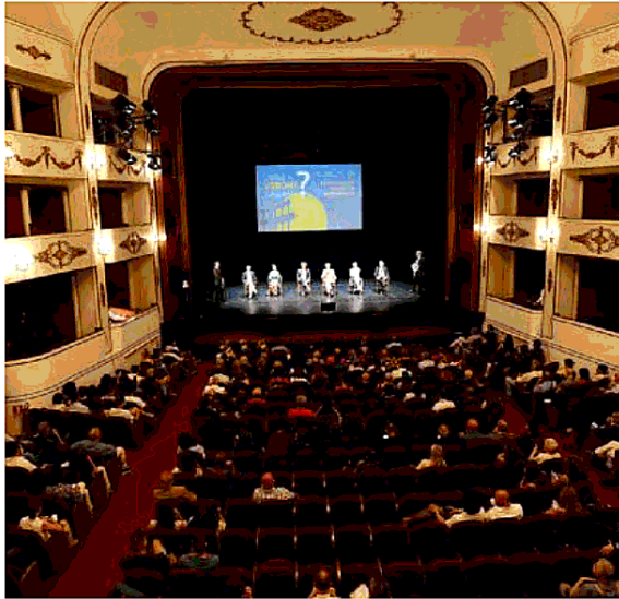
Il Teatro Nuovo Qui la cerimonia di premiazione della VI edizione del premio