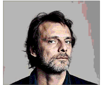
Alessandro Preziosi L'attore leggerà i brani