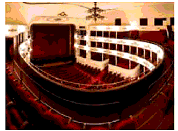
Il Teatro Nuovo A Verona ospiterà la finale